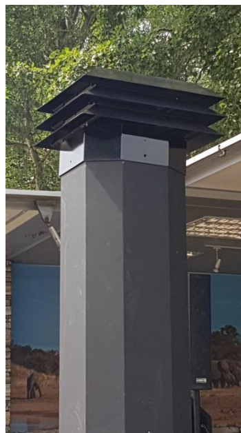
La girouette sud-africaine est disponible sur commande.

Ce chapeau freine également la sortie des étincelles.